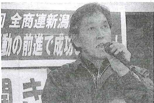
活動報告する本名さん・松浜支部

支部の自主計算班会を成功させよう。そのために税金相談員学習会にたくさんの役員のみなさんの参加をお願いします。