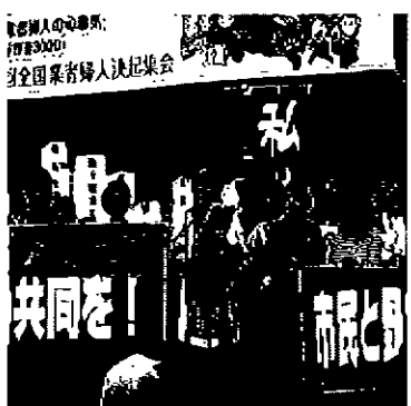
「市民と野党の共闘で勝利！」 飛田野県婦協副会長(三条)と県内の婦人部代表が舞台上

新潟県からは、飛田野県婦協副会長(三条)が、「衆議員選挙で、市民と野党の共闘で勝利した新潟4区のただかい」を報告。大きな拍手と歓声につつまれました。