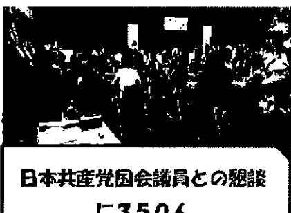
日本共産党国会議員との懇談 に350人