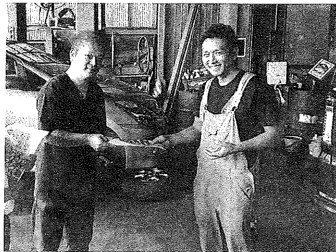
青年部・部員訪問

家族経営の小さな会社なので、仕事が重なってしまうと、お待たせすることも有りお客様