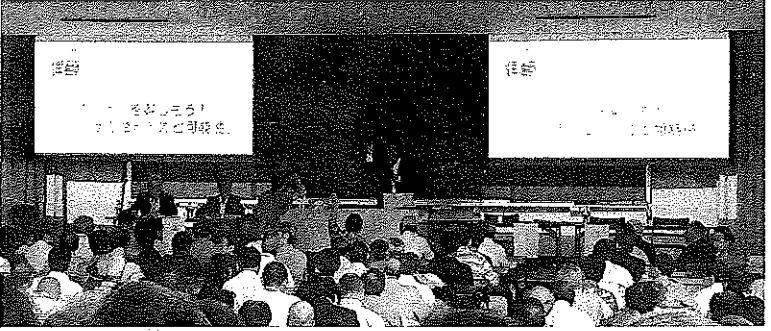
特別報告「まちゼミの力と可能性」

出会い、商業者同士の繋がりが生まれ、店の経営革新にも繋がるなどの個店活性化と商店街活性化を同時に行うことができる企画です。店の跡継ぎがいなかった店舗で「まちゼミ」を通して後継者ができたなどの実例を上げ、まちゼミの効果を説明しました。