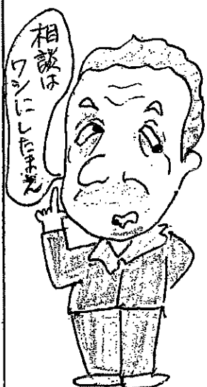
相談はワシに任せなさい

☆(W男さん) 相談する相手のいい人は、犬や猫でもいいから話し相手になるそうです。昔者おはだいたい犬を飼ってると言います。