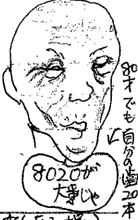
80才でも自分の歯20本