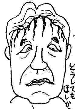
どうしてかぼんぼんしたのです

☆(W男さん) 昔、近所に年中頭から血を流している青年がいました。髪の毛を植えていたのです。