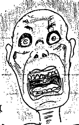
オリンピックまで生きていたい……

☆(うちのじいさん) 「東京五輪まで生きていられるか」とばかりあって、サプリメント飲んでます。今年の寄りは何をいなくても百歳まで生きられます。