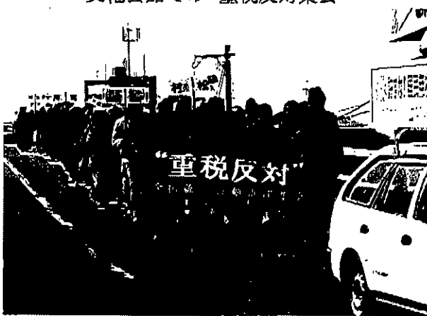
“重税反対”のデモ行進