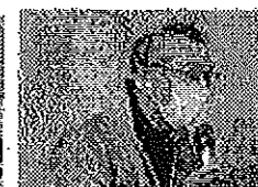
アピール提案・ 会員へのお願い 小式沢副会長