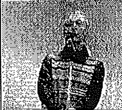
小沢副会長の司会で開会