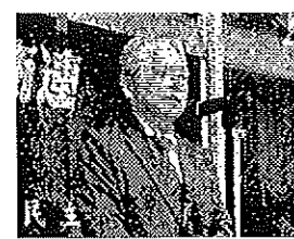
日本共産党三条市議、小林市議団長