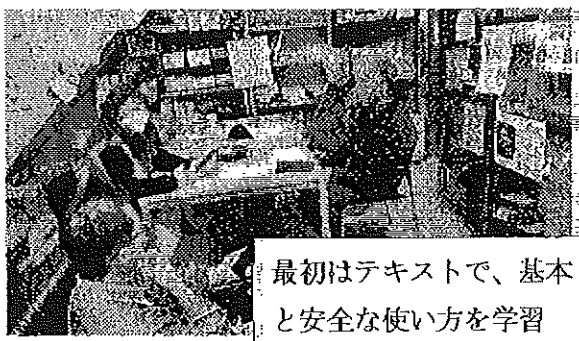
最初はテキストで、基本と安全な使い方を学習

安心してスマホを使うために覚えておくべきことやスマホをもっと便利にするための知恵など、初心者向けスマホの基本的な操作方法から、中～上級まで知っておいて損はない、おすすめアプリや最近の詐欺メールの傾向を話していただきました。