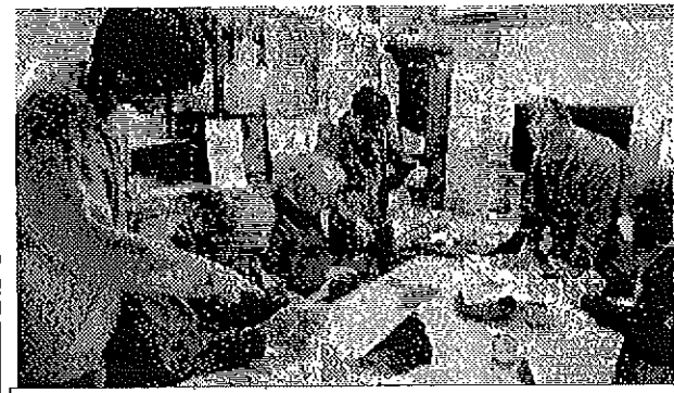
マンツーマンで教え合い、良くわかりました!

その後、Wi-Fiの意味、つなぎ方、スクリーンショットのやり方を実践。「知らない電話番号は出ないこと。危険な番号は検索することもできるよ。」「番号の最初に+の電話が来た」「それは外国からの電話だから絶対出ちゃダメ」「ラインのつなぎ方」をお互い教え合ったり、講師、サポーターだけでなく、みんなが先生、みんなが生徒で教え合いました。ラインは受けることができるけれど発信できない方には、「自分の声を入れて送ったり、声を文字にして送る方法」、間違ってしまった時の