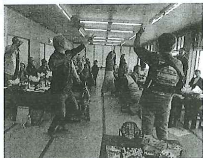
ビンゴゲームも盛り上がりましたが、じゃんけん大会も大盛り上がり