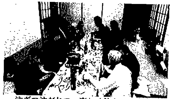
注ぎつ注がれつ、楽しく飲んでいきます。