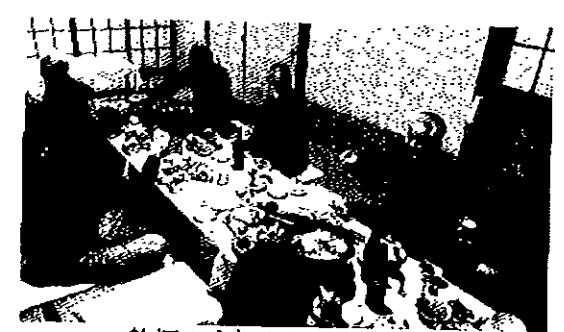
乾杯！今年もがんばろう！

加した会員全員と事務局)が活動しました。関原支部は、1月下旬より班会を行います。確定申告までに2回班会を行う班が多く、初回の班会では例年自主計算パンフレットを用いた学習を行っています。今年はこれに加え、マイナンバー制度についても話し合う予定です。