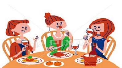
pikta.jp - 35571176

婦人部の皆さん、久しぶりにランチ会を計画しました。時間は限られますが、商売の話や思っていることなど沢山お話ししましょう♪ 遠慮なく参加して下さい。