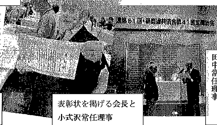
表彰状を掲げる会長と小式沢常任理事