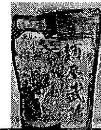
名店スープ しょうゆ 400円