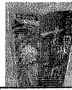
名店スープ みそ 400円