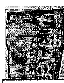
名店スープ 白湯 400円