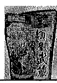
名店スープ しょうゆ 400円