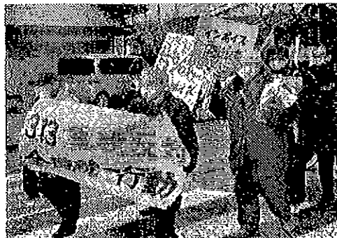
加茂ドックの日程

3・13 重税反対全国統一行動 ☆三条集會に 82人(訂正) 三条中央公民館・大集會室 9時開會 ☆加茂集會に 26人(訂正) 加茂文化會館小ホール 14時開會