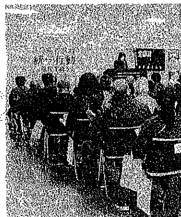
基調報告（田村事務局）