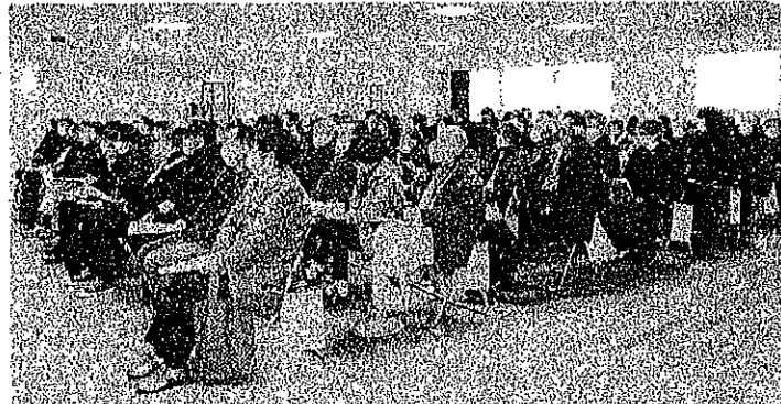
100名超す燕地区集会参加の方々