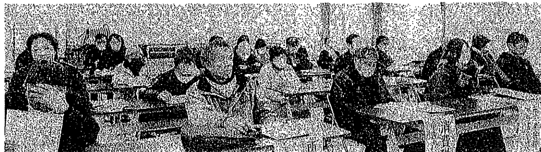
吉田地区でも申告書持参で集会