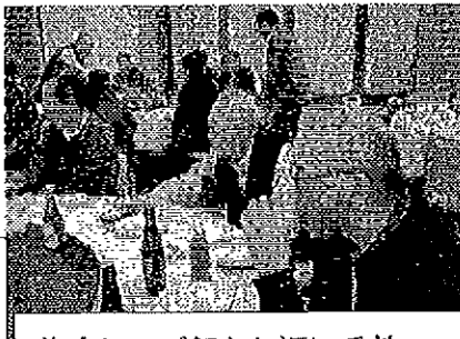
美味しいご飯とお酒に舌鼓