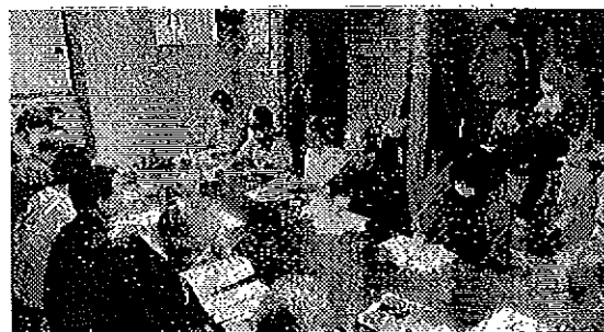
10/11のインボイス実務学習会には19人が参加し、多くの質問が出されました

民商・全商連はインボイス制度中止からインボイス制度廃止へと切り替えて、中小業者を苦しめるこの制度が廃止されるまで署名を集め続けます。みなさんの力が政治を動かします。署名へのご協力をお願いします。学習会で署名をお願いします。11/6(日)で配布します。