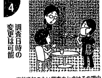
事前通知のない調査のときはその理由を確認しましょう。調査の日時、場所について都合の悪いときは変更させることができます (国税通則法74条9、裁法13条・31条、国税庁の税務運営方針)