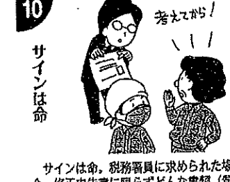
サインは命、税務署員に求められた場合、修正申告書に限らずどんな書類(質問応答記録書など)でもその場でサインせず、よく考えてからにすること(公務員の職務乱用罪・刑法193条)

巻末の「巻末の巻末」 「事前通知の電話で応答がなかったために、やむなく今回直接訪問しました。」(9月13日建築業) 事前通知が税務署員に義務付けられています。