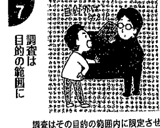
調査はその目的の範囲内に限定させること。「資料の提供を求めたりする場合においても、できるだけ納税者に迷惑をかけないように注意する」(裁法13条・31条、国税庁の税務運営方針)