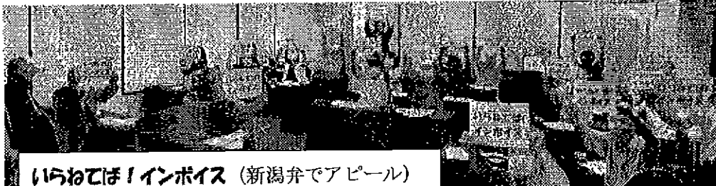
いらねば！インボイス (新潟弁でアピール)

7月記帳会・相談会 7月22日(土)9時半 事務所 手書きの方もどうぞ。 インボイス申請は9月末までOK。 過ぎても溯って有効。取り下げも可能。