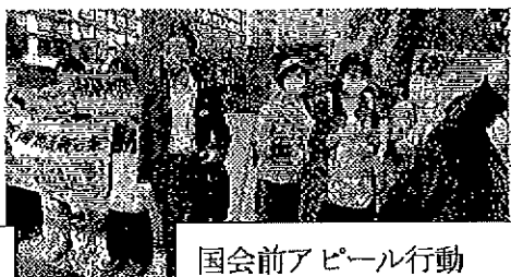
国会前アピール行動

三条民商第76回総会 共済会第39回総会 三条ロイヤルホテル 7月15日（土）16時〜総会・懇親会18時〜 会費5800円（民商と各支部より補助します） コロナ前と同様な開催。各支部より代議員選出 定数は31名。各支部からよびかけます。