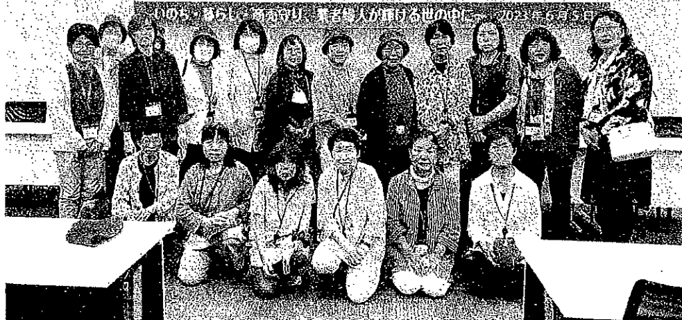
新潟県代表団の皆さん