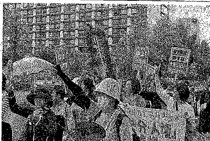
インボイス中止・消費税5%・所得税法56条廃止をアピールする人たち=5日、東京都内