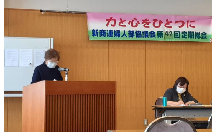
代表発言をする阿部婦人部長(左)