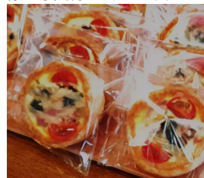
様々な具材が入ったキッシュ