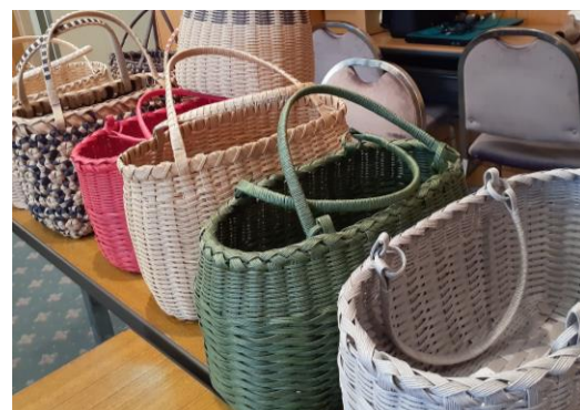
色とりどりの手作りかご編みバッグ