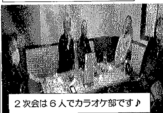
2次会は6人でカラオケ部です♪