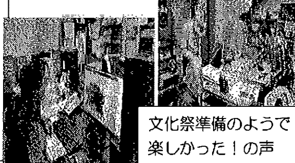
文化祭準備のようでした！の声

3・13準備 3/8 常任理事が集まり、名監督(腰痛で動けない笑)の指示のもと、パソコンのエキスパートが文字を出し、看板のエキスパートが打ち出した紙をプラカードに貼り、そしてのぼり旗と、手際よく準備されました。