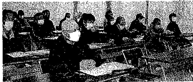
吉田会場（産業会館）