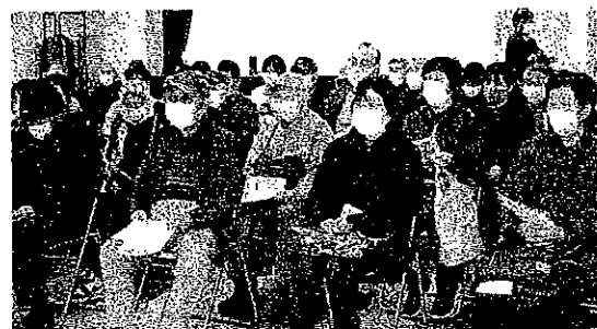
燕会場（中央公民館）

これ以上の増税するな！ 全国一斉に開催されました。 燕民商でも燕、吉田の2会場で開催しました。前日とは打って変わった雨の悪天候となりましたが、多数の納税者で賑わいました。 インボイス制度への対応などもあり、三条新聞社も取材に訪れました。