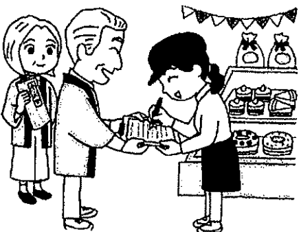
消費税減税、インボイス中止