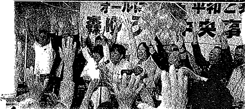
オールにいがた 平和と共生ニュースより

大激戦に競り勝った市民の勝利 民商・新商連は、平和憲法を守り立憲主義を貫く立場から、安倍暴走政治に歯止めをかける野党統一候補「森ゆうこ」当選のために全力を尽くしてきました。民商会員商工新聞読者の方々の「ご支援」に厚く御礼申し上げます。憲法を守り抜く闘いの本番が始まります。