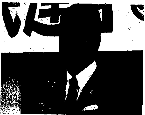
原発再稼働反対、福祉、中小業者優先の県政へ！

原発再稼働賛成：24.2% との結果も出ています。TPPの強行に反対し、暮らし、福祉、医療優先の県政を作りましょう。