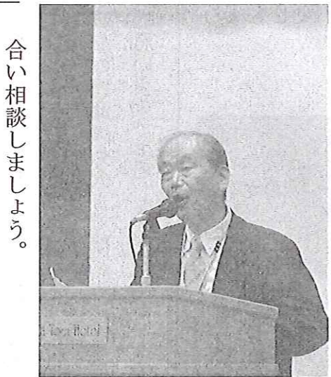
合い相談しましょう。