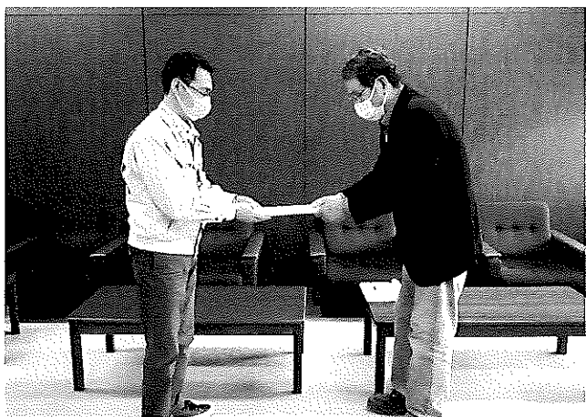
竹内会長(右)、地域経済 振興課担当者(左)

2、村上市が行う経済支援策の申請・実施に あたっては、市民税の完納が見込まれる人 の申請を認める等、実情に合わせて柔軟に 対応してください。感染拡大が長期化する 場合、施策の継続・拡充を行ってください。 など全6項目について要望しました。