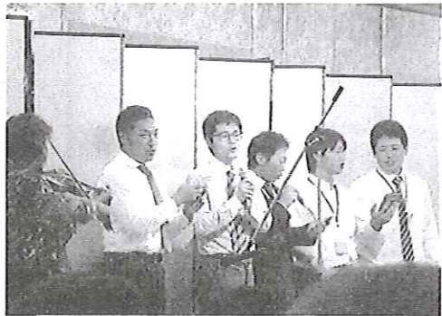
バイオリン演奏&青年部合唱