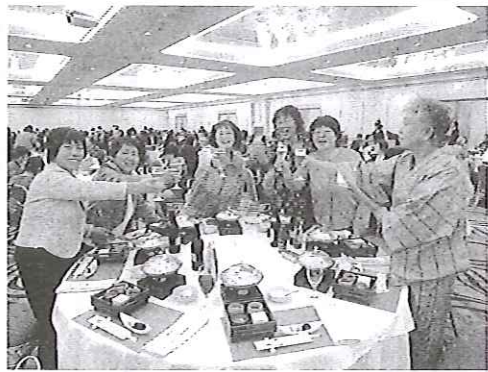
新潟県チームの夕食会

『民商に入会して五年目です。主人はタイル工事一人でやっています。市税と国保の滞納で民商に入会し、事務局や婦人部の役員さんにお世話になったので私ができることはお手伝いさせていただけよう」と商工新聞の配達や集金をしています。みなさんから協力頂きながら、新潟民商婦人部長と県婦協副会長を務めさせていっています』と自己紹介すると感心の声。県知事選挙勝利報告でも『立候補したのは告示の六日前。民進党は自主投票。そんな状況で六三〇〇〇票の大差をつけて圧勝！原発再稼働は認めない・県民の揺るがない意志が明確に示された選挙でした』に会場はどっと沸きました。JA女性協との県議会への共同請願は難しい、県議会は継続審議となりましたが、共産党議員以外にも広がりを見せ、行動すれば道は開けると確信した事。婦人部三役・支部長が協力し、五〇名の仲間が増えた事も報告できました。ありがとうございました。