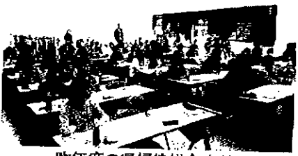
昨年度の県婦協総会より

4月19日(日)、新商連婦人部協議会(県婦協)第38回定期総会が開催されます。参加したことがある方はもちろん、参加したことのない方も、参加してみませんか? 業者婦人の仲間から、明日への元氣と希望をもらえます。近年、スマホを持つ子どもが増えました。しかし、スマホを使った事件・犯罪も増加しています。県婦協では、このような犯罪から子どもを守るため、同日「子どものスマホ安全教室」を開催します。ぜひご参加ください。 参加ご希望の方は4月7日(火)締切予定日までに最寄りの婦人部役員、または事務局にお申し込みください。