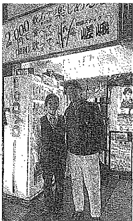
老舗スナック「和風スナック嵯峨」のマスター(左)とともに