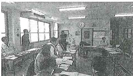
◀ 昨年の作成会 ▶