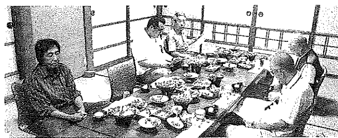
消費税についての説明を受ける参加者

新入会員さんも民商の活動 への理解も深まり「今後集ま りがあればまた参加したい」 と期待を寄せてくれました。