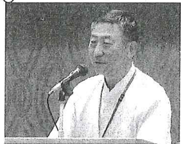
野上会長の あいさつ