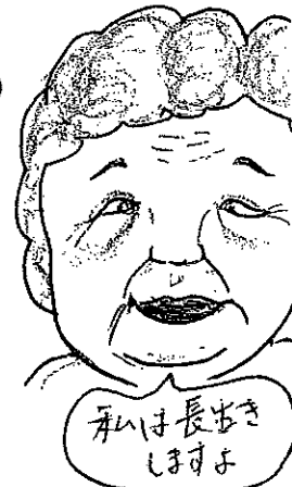
私は長生き ほすよ

25年前に夫は「父と母 を頼む」といって七くは り、3年前二人の両親 をみおくり、今はじっ くり自分を労りなが ら生活しています。