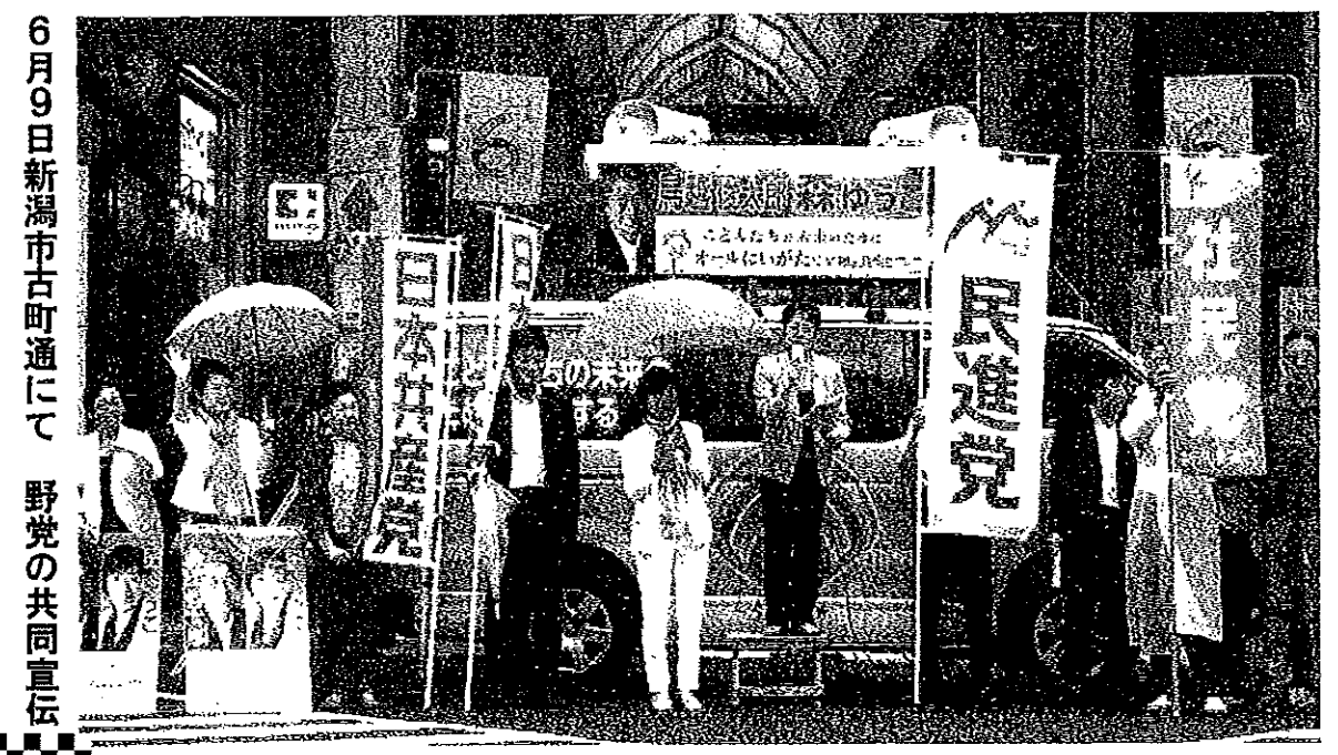
6月9日新潟市古町通にて 野党の共同宣伝

P.001/001 FAX番号:0256-64-4509 2016/06/23/木 11:59 燕民主商工会