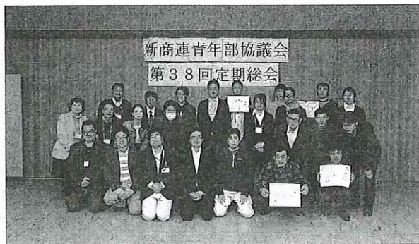
総会参加者一同 次回の県青協総会は更に、多くの参加者と共に!(下)