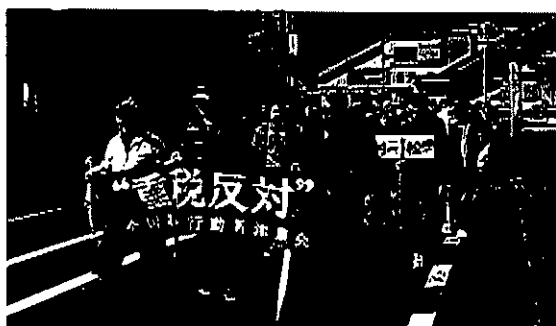
新津駅前を元気に行進するデモ隊