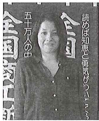
読めば知恵と勇気のついでに、五十万人の心

右も左もわかりませんが、一日も早く事務局員みなさん、役員みなさま、そして会員みなさまの力になれるように頑張りたいと思っております。どうぞよろしくお願致します。