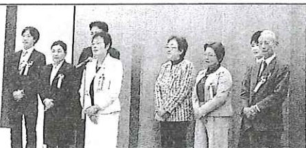
政治は変わる、変えられる時期