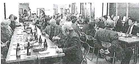
おいしいお酒 と料理に舌鼓