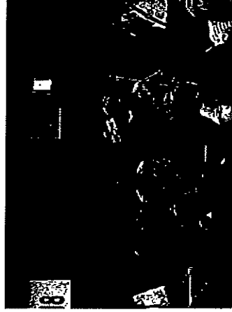
抽選会で当たり！4軒目へ？